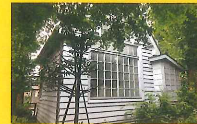
Saeki Yuzo Atelier Museum 佐伯祐三アトリエ記念館