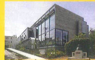
Natsume Soseki Memorial Museum 漱石山房記念館