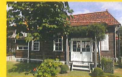
Nakamura Tsune Atelier Museum 中村彝アトリエ記念館