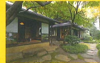
Hayashi Fumiko Memorial Hall 林芙美子記念館