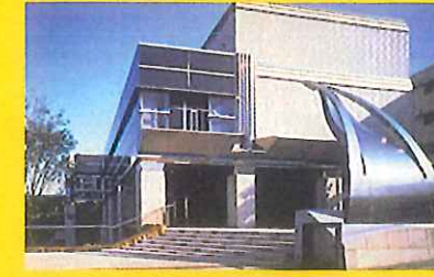
Shinjuku Historical Museum 新宿歴史博物館