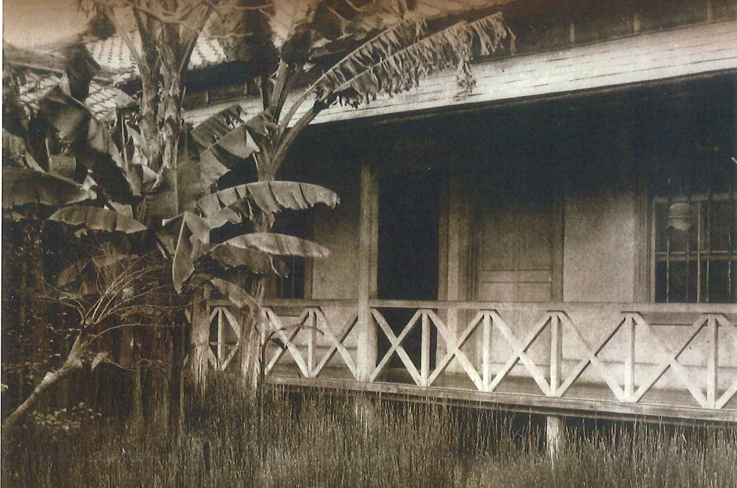
漱石山房外観(大正5年12月) 松岡譲編『漱石写真帖』